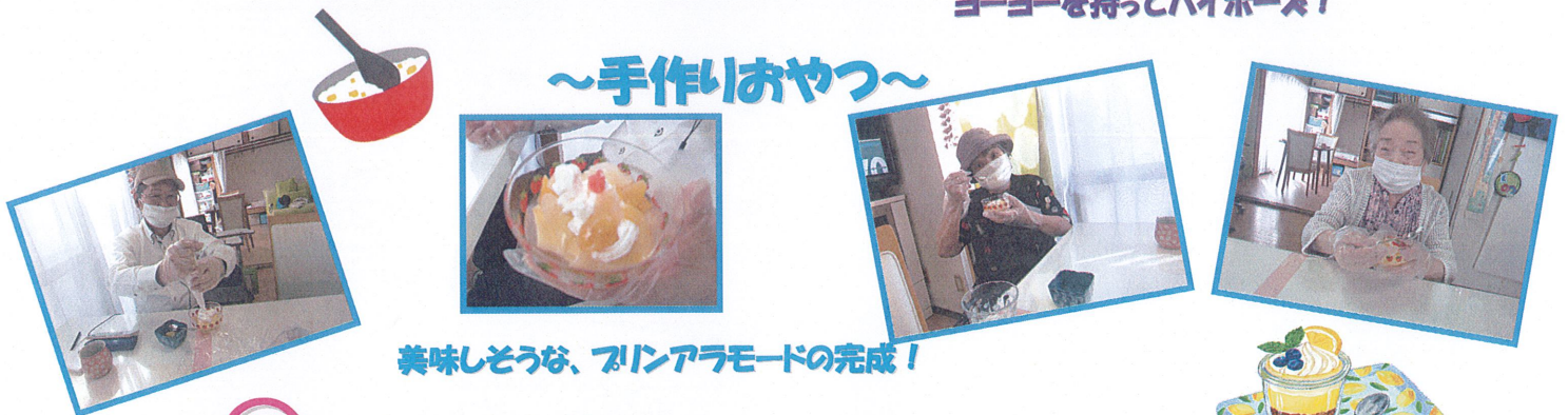
美味しそうなおやつ、フィンアラモードの完成！