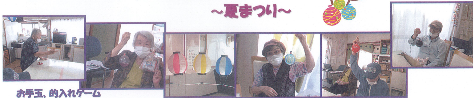
お手玉、的入れゲーム